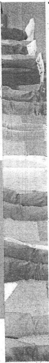
PL promoveu evento com destaque para candidatos jovens

quer que seja reduzido (o número de candidatos à direita), agora a gente tem de levar em consideração algumas coisas", respondeu, acrescentando: "primeiro, quem está crescendo nas pesquisas, qual o maior partido, quem tem o apoio da maior liderança e quem tem hoje uma maior militância engajada nas ruas".