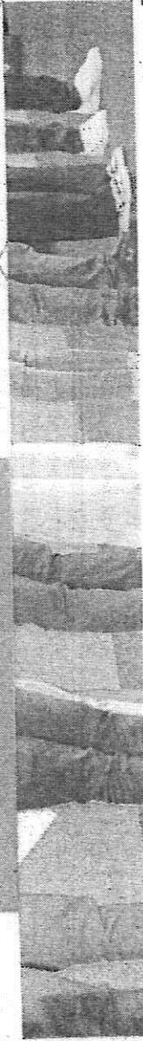
PL promoveu evento com destaque para candidatos jovens

quer que seja reduzido (o número de candidatos à direita), agora a gente tem de levar em consideração algumas coisas", respondeu, acrescentando: "Primeiro, quem está crescendo nas pesquisas, qual o maior partido, quem tem o apoio da maior liderança e quem tem hoje uma maior militância engajada nas ruas".