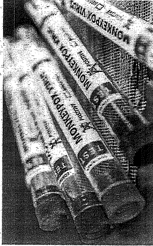
O vírus monkeypox não apresenta tanta variação, diz pesquisadora

Com o risco de introdução da variola dos macacos no Brasil, que investiga três casos suspeitos, aumenta o receio da população da ocorrência de uma nova pandemia além da Covid-19 — que ainda não acabou. Conforme especialistas em infectologia e virologia, é possível que o número de casos aumente, mas é improvável que variola dos macacos atinja as proporções do Sars-Cov-2. Foco deve ser no isolamento dos casos confirmados.